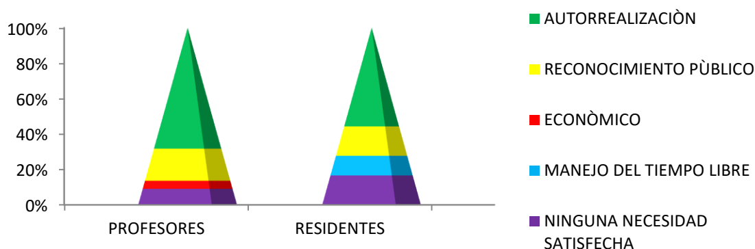
Tabla 2. Satisfacción de las necesidades personales según pirámide de Maslow.