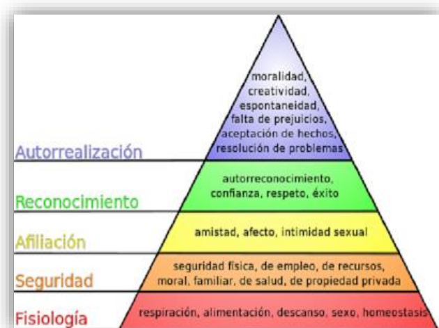
Figura 1. Pirámide de Abraham Maslow: 5, 6

Como se puede observar, en la base están las necesidades básicas, que son necesidades referentes a la supervivencia; en el segundo escalón están las necesidades de seguridad y protección; en el tercero están las relacionadas con nuestro carácter social, llamadas necesidades de afiliación; en el cuarto escalón se encuentran aquéllas relacionadas con la estima hacia uno mismo, llamadas necesidades de reconocimiento, y en último término, en la cúspide, están las necesidades de autorrealización. 6